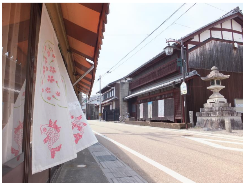
中山道愛知川宿にふわり！（昨年展示より）